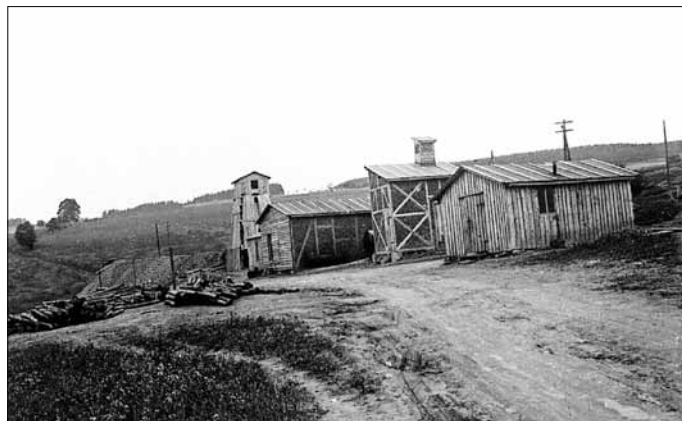
Schachtanlage „Reicher Spat“

Der mit allen Mitteln durchgeführte Uranerzbergbau brachte für die Region und die bodenständige Bevölkerung krasse Veränderungen und Opfer mit sich. Landwirtschaftliche Flächen wurden beschlagnahmt, sowie Häuser Gaststädten, Pensionen und Fabriken für die Unterbringung von sowj. Soldaten und Bergleuten.