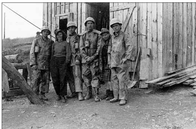
Windenhause Schacht „Fürst Michaelis“

1947 wurde ein eigener Polizeiapparat aufgebaut, der bis 1990 existierte. Auch ein eigenes Justizwesen entstand. Ein Apparat der Staatssicherheit existierte bis 1983. Die Gebietsorganisation der SED organisierte die politische Arbeit mit der Gewerkschaft und vielen Massenorganisationen. Es entstand ein eigenes Gesundheitswesen und Sozialversicherung. Ein Transportbetrieb entstand, um logistische Aufgaben selbst zu lösen. Umfangreich war der Arbeiterberufsverkehr. Ein Handelssystem, anfangs Konsum, später HO besorgte, was gebraucht wurde. In „Magazinen“ erfolgte der Verkauf an die Bergleute. Eine Arbeiterversorgung sicherte das warme Mittagessen und später auch den Frühstücksbeutel ab.