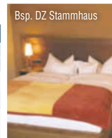
Bsp. DZ Stammhaus

Weitere Termine und Informationen bzgl. Zuschlägen, zusätzlichen Zimmerkategorien, Inklusivleistungen, Kinderermäßigungen, Mitnahme von Hunden usw. finden Sie auf reisenaktuell.com . Mit Erhalt der Reisebestätigung wird eine Anzahlung in Höhe von 20 % des Reisepreises fällig. Die Restzahlung ist 30 Tage vor Abreise zu tätigen. Veranstalter: Reisen Aktuell GmbH, In den Veniken 1, 56070 Koblenz