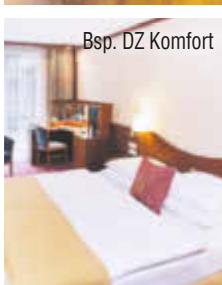
Bsp. DZ Komfort